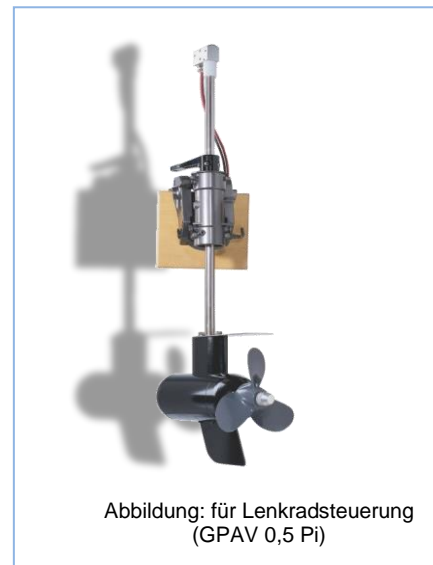
Abbildung: für Lenkradsteuerung (GPAV 0,5 Pi)