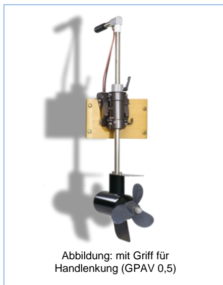
Abbildung: mit Griff für Handlenkung (GPAV 0,5)

Mit der praktischen Einhebelbedienung ist eine stufenlose Drehzahlregulierung im Vor- und Rückwärtsgang möglich. Die hochwertige, elektrische Regelung arbeitet nahezu verlustlos und schützt Ihren wertvollen Batteriesatz gegen zu tiefe Entladung. Die moderne Leistungselektronik hilft, den Antrieb optimal an Ihr Schiff anzupassen.